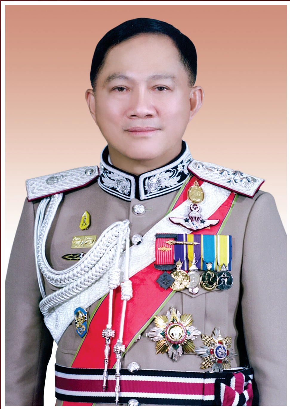
พลตำรวจเอก อุดุลย์ แสงสิงแก้ว ผู้บัญชาการตำรวจแห่งชาติ